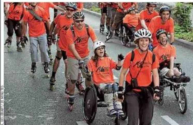
Les 53 sportifs vont parcourir plus de 500 km pour rejoindre Londres.

Article sur le défi Paris-Londres. le 30/08/12