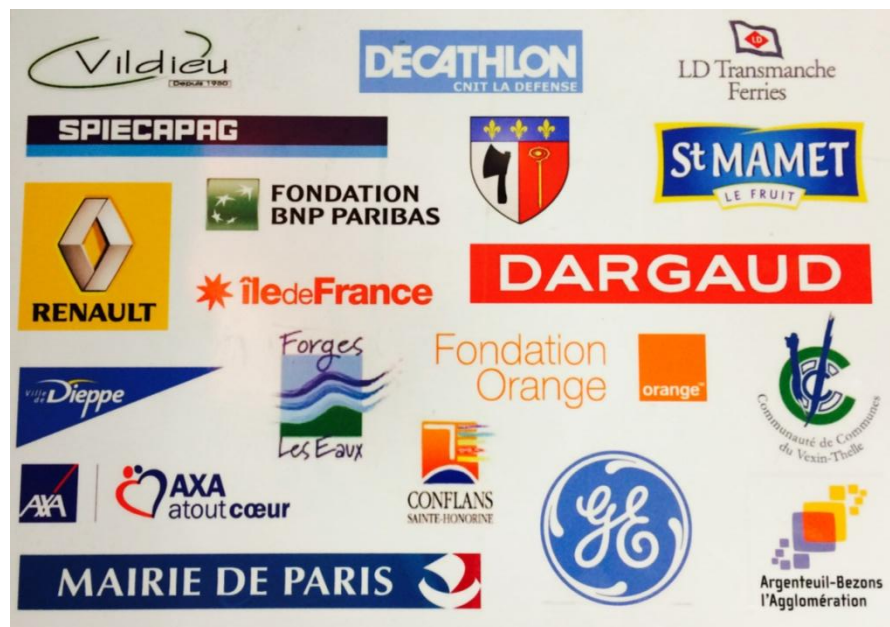
Partenaires sur le Paris-Londres en 2012